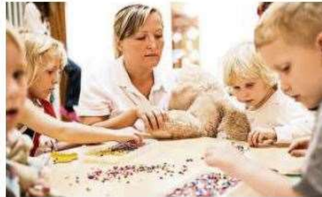
Jugend-Reha: Das Kind steht im Vordergrund.

zwei Jahre zuvor. Die Ausgaben der Rentenversicherung dafür beliefen sich auf 205 Millionen Euro. Hauptgründe für die vier- bis sechswöchige Behandlung in einer Reha-Klinik waren psychosomatische Erkrankungen wie ADHS (Aufmerksamkeitsdefizit-Hyperaktivitätsstörung), chronische Atemwegserkrankungen wie Asthma sowie krankhaftes Übergewicht (Adipositas). In Deutschland sind nach Schätzungen 15 Prozent