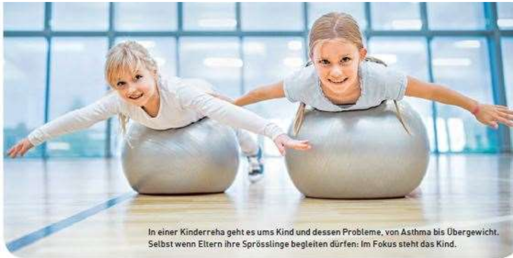
In einer Kinderreha geht es ums Kind und dessen Probleme, von Asthma bis Übergewicht. Selbst wenn Eltern ihre Sprösslinge begleiten dürfen: Im Fokus steht das Kind.